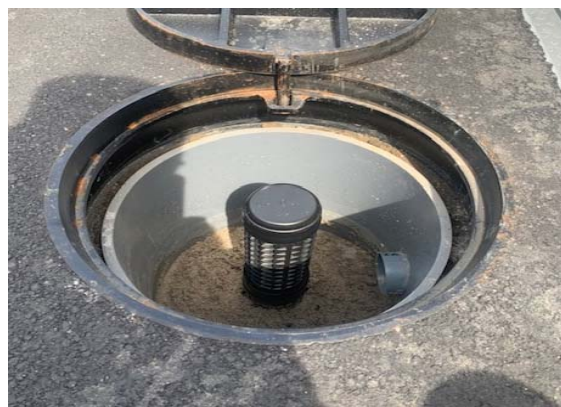
雨水地下浸透柵新設