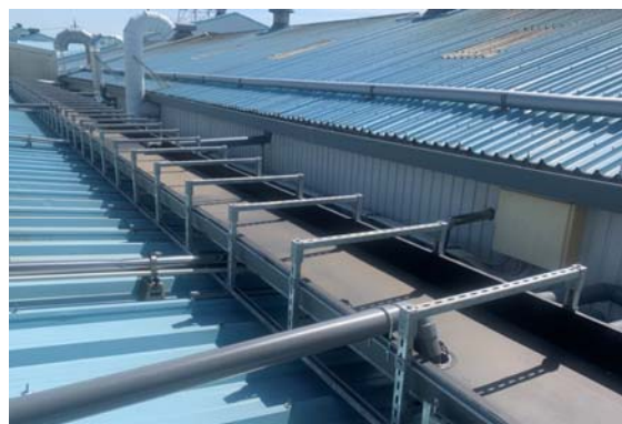
雨樋拡張による雨水排出能力の向上